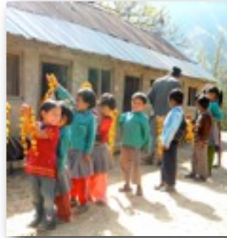
Inauguration du nouveau toit

Depuis septembre 2009, date de la première AGA de CQN, plusieurs projets reliés à l'éducation ont été réalisés. Cinq écoles ont reçu 400$ chacune pour acheter ce dont elles avaient besoin, tel que décrit dans le Projet d'aide aux écoles primaires . Ce projet a permis à certains enfants venant de familles très pauvres à d'aller à l'école.