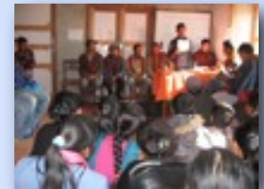
Grande participation à l'AGA de la SPSWO

L'Assemblée générale annuelle de l'ONG locale, la SPSWO, a été tenue le 8 décembre 2010 au Centre communautaire du village de Syauri. Elle a réuni 170 personnes venant de quatre Village Development Committees (VDC) donc 130 d'entre elles sont devenues membres pour l'année en cours.