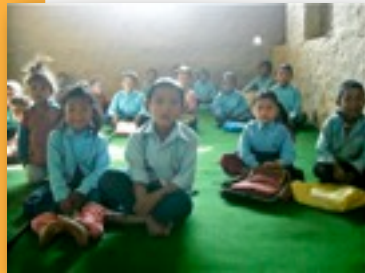
Enfants bénéficiaires du Projet d'aide aux écoles primaires

L'école Shree Bal Ujwal Lower Secondary School a bénéficié d'un nouveau réservoir de stockage d'eau avec une barre de robinets, afin de répondre aux besoins grandissants de l'école en eau. De plus, un système de captage d'eau de pluie, comprenant des gouttières et un réservoir souterrain pour récolter l'eau a été construit. Il reste maintenant à améliorer le système sanitaire de l'école pour finaliser le projet.