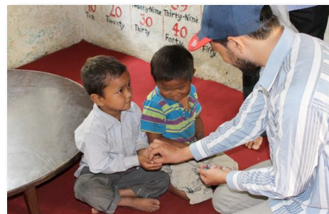
Remise aux écoliers népalais de bracelets fabriqués par les élèves de l'école St-Barthélemy

CQN a participé pendant trois jours, en septembre 2017, au Mondo Karnaval, une activité festive où nous tenions un kiosque pour nous faire connaître et parler du Népal. Nous y serons aussi en septembre 2018. Nous sommes intéressés à participer à d'autres activités si cela se présente.