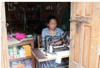
La professeure de couture dans son local

Le Centre de santé communautaire a continué à consacrer son budget au personnel de la santé, aux médicaments, aux boîtes de premiers soins pour les écoles, au programme de prévention pour les groupes de femmes et à la tenue d'un « camp de santé » dans les villages éloignés. Tout comme en 2016, le Centre communautaire étant en attente d'être reconstruit, le Centre de santé a été relocalisé dans la maison de la travailleuse de la santé.