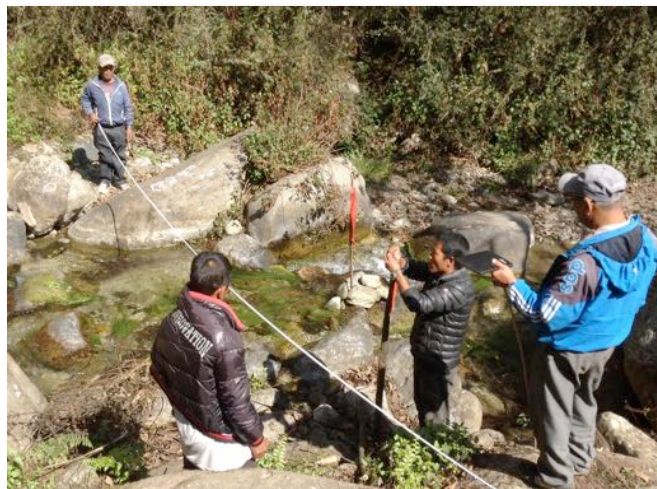
Préparation d'un projet d'eau pour les villages de Syaury et Pangu

L'an dernier, CQN a supervisé le projet de santé, un projet pour 14 écoles, la construction de toilettes. Beaucoup d'énergie a été investie dans la préparation de gros projets qui devraient débiter sous peu : l'eau potable, la reconstruction du Centre communautaire et la suite de la construction des toilettes dans Sikhar Ambote.