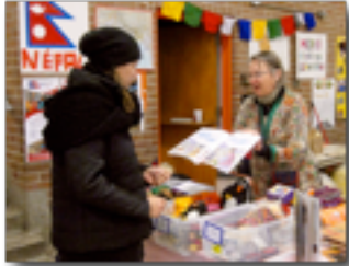
Les étudiants de St Barthélémy continuent d'aider CQN

Nous terminons notre année avec un solde de 8 661,81 $, qui inclut les sommes provisionnées.