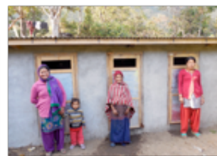
un projet de zone sans défécation à l'air libre