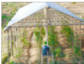
Des matériaux recyclés pour la reconstruction