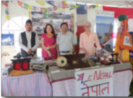
Le kiosque Nepal-CQP attire beaucoup d'attention au MondoKarnaval