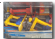
Les outils sont essentiels pour le maintien des projets d'eau

Démolition du Centre communautaire. Le Centre communautaire est au centre de notre travail au Népal. Malheureusement, il a été lourdement endommagé lors des séismes et a été déclaré « perte totale » par les ingénieurs du gouvernement. Lors de sa démolition, on a récupéré tous les matériaux possibles (portes, fenêtres, tôle, etc.), qui pourront être réutilisés lors de la reconstruction. L'objectif est de procéder le plus vite possible, en suivant les normes parasismiques conformes aux directives émises par le gouvernement népalais.