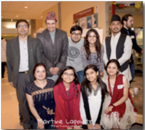
L'implication des bénévoles Népalais est inestimable pour le travail de CQN

Pour résumer la situation au Népal, disons qu'après le tremblement de terre, les gens se réorganisent à tous points de vue et que, pour CQN, l'horizon est rempli de projets et de nouveautés.