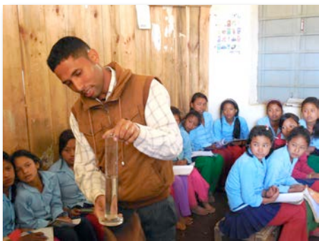
Les professeurs ont maintenant les outils pour les cours de science

En ce qui concerne les écoles , 3 écoles ont acheté du matériel de science . Deux d'entre elles n'avaient aucun matériel pour donner leurs cours. Des sommes ont