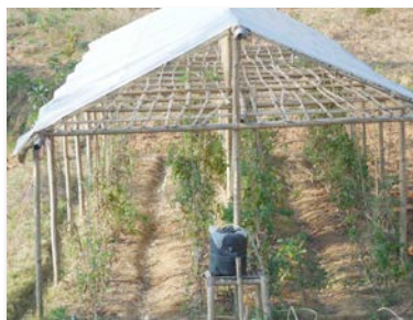
La production en tunnel augmente les revenus

Une formation sur la production de tomates en tunnels