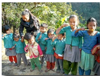
Les cours d'hygiène à l'école

Lors du voyage au Népal en décembre 2013, CQN a été approchée pour démarrer plusieurs nouveaux projets. Plusieurs nouveaux projets sont prévus pour l'année à venir.