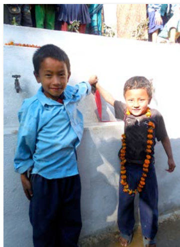
L'inauguration officiel de la barre de robinets

également été allouées pour financer le projet cahiers-crayons et 6 enfants ont continué à recevoir des écolages/parrainages pour les aider à aller à l'école.