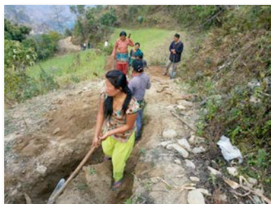
Le travail de creusage est partagé par tous

Le projet d'eau potable pour les villages de Khahare/Chuitingtar , qui a débuté en 2011, a suivi son cours avec la construction du pipeline pour relier le réservoir de captage avec les deux réservoirs de stockage d'eau : creusement des tranchées, pose de tuyaux et remblayage. Ce projet vise à alimenter en eau potable les deux villages ainsi que toutes les maisons qui se trouvent le long du parcours du pipeline. La dernière étape sera la construction du système de distribution.