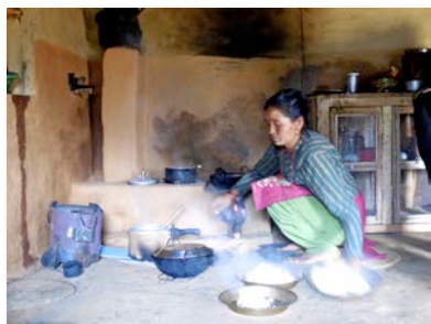
Les poêles améliorent la qualité de l'air

Cette année, une formation a été donnée au Centre communautaire sur la construction de poêles améliorés . Cette formation vise à former des femmes des villages pour qu'elles puissent ensuite aider chaque maisonnée à construire son propre poêle. Jusqu'à présent, environ la moitié des 360 poêles prévus pour cette année ont été construits.