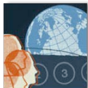
Fondation 3 % Tiers-Monde

Collaboration Québec Népal remercie tous les membres, les personnes, les fondations et les organismes qui lui permettent, en donnant généreusement, de réaliser sa mission.