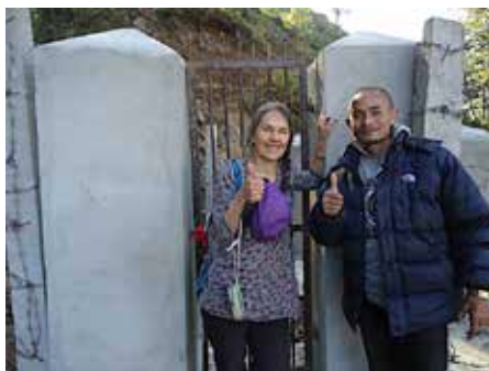
Réservoir d'eau de K/C

qui avait débuté en 2011, a suivi son cours avec la construction du réservoir de captage et des boîtes d'embranchement. Ce projet vise à alimenter en eau potable les deux villages ainsi que toutes les maisons