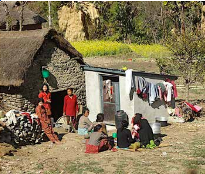
Toilette multi-usage !