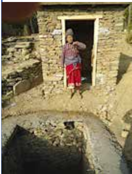
Construction d'une toilette

Indiscutablement, le plus gros projet démarré en 2012 est celui des toilettes pour le VDC de Khahare Pangu . Il est important de noter que ce projet, qui vise la