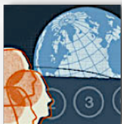
Fondation 3% Tiers-Monde