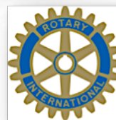
Club Rotary de Calgary Sud