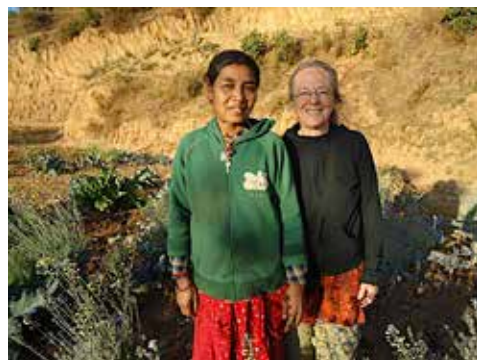
Jardin du Centre communautaire

compris une formation en apiculture et diverses rencontres des groupes locaux. Un grand jardin a été aménagé sur les terres inutilisées. Le terrain a été nivelé et la terre préparée pour la plantation de légumes et d'arbres fruitiers. L'objectif est de vendre le surplus de fruits et de légumes pour aider à financer le Centre. Des barres de sécurité ont été installées aux fenêtres des locaux de couture afin de contrer le vol.