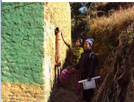
Cheminée extérieure d'un poêle

qui se trouvent le long du parcours du pipeline reliant le réservoir de captage aux deux réservoirs d'eau. Le projet prévoit la construction d'un réseau de distribution incluant 33 fontaines publiques.