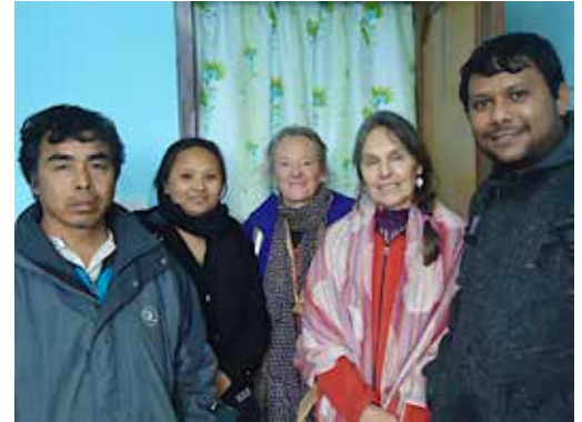
Nouvelle équipe administrative de SPSWO avec deux représentantes de CQN

Plusieurs besoins ont été identifiés. Nous recherchons des personnes qui auraient des aptitudes en infographie, en journalisme et en rédaction, ainsi qu'en traduction de documents, surtout du français vers le népalais. CQN aimerait également mettre sur pied un Comité de promotion de notoriété pour faire connaître CQN à grandeur du Québec. Cela impliquerait de faire des présentations auprès des organismes et de produire du matériel promotionnel. Pour terminer, CQN aimerait mettre sur pied un Comité de collecte de fond , qui serait responsable des levées de fond auprès des particuliers, des fondations et des sociétés, ainsi que pour la tenue de différentes activités de collecte de fonds.