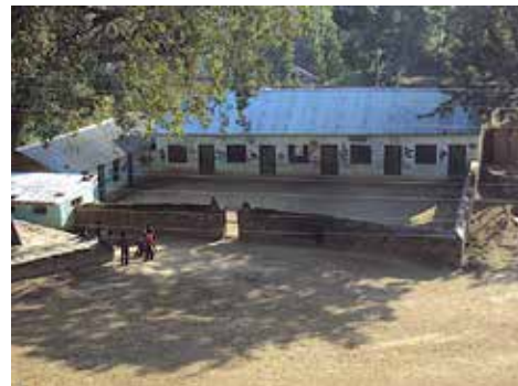
École de Chaundi

Une fosse septique a été construite pour l'école de Dapcha, ce qui