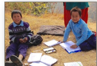
Le projet cahiers-crayons