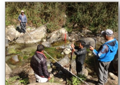
Préparation du projet

Ce projet implique la construction d'un réservoir de captation et de trois pipelines : un de 1040 m (Sano Bhugdeu), un de 3000 m (Patwaal) et un de 5140 m (Syauri et Pangu Besi). À noter que les trois pipelines partageront la même tranchée, avec des connexions aux endroits appropriés pour les différents villages. Les tuyaux seront enfouis à une profondeur de 90 cm. Ce sont les gens des quatre villages qui creuseront et rempliront la tranchée.