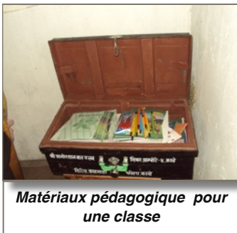
Matériaux pédagogique pour une classe