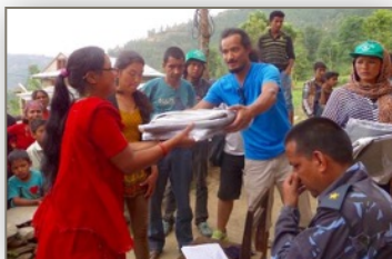
Distribution de couvertures au Népal en 2015