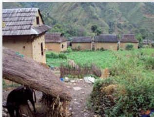
Les toilettes procurent un environnement plus sain aux villages

pour les personnes âgées. Il leur fallait aller faire leurs besoins dans les champs avoisinants et ils étaient toujours inquiets que quelqu'un ne les voie. Pour les femmes menstruées, c'était encore pire.