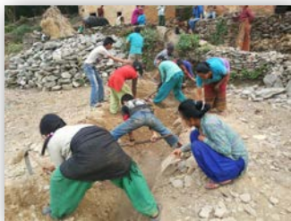
Les villageois creusant des tranchées pour l'installation des tuyaux d'eau

J'aimerais commencer par remercier le Comité de construction ainsi que SPSWO (ONG locale avec laquelle œuvre CQN) pour leur gestion du projet. J'aimerais tout spécialement remercier les villageois qui ont travaillé sans relâche afin de parachever le projet à temps. Vous êtes les vrais héros de ce projet! Je suis montée jusqu'au réservoir de captation en suivant le tracé du pipeline, et je peux confirmer que c'est un terrain difficile, montagneux et accidenté! Les matériaux de construction ont été transportés à dos