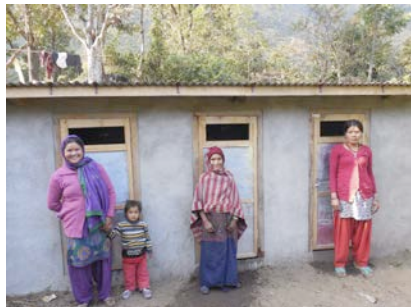
Toilettes pour tous dans le VDC de Khahare Pangu

294 toilettes supplémentaires ont été construites pendant la troisième année du projet de toilettes pour le VDC de Khahare Pangu (un VDC est similaire aux MRC), cofinancé par