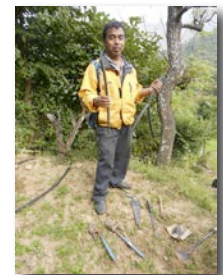
Formation en plomberie

Le Centre communautaire a continué d'accueillir divers groupes locaux et plusieurs formations ont eu lieu. Une cours de couture avancée a été donné à 30 femmes. Une formation a été tenue dans quatre écoles par l'organisme local OSIE ( One Step In Environment ), afin de sensibiliser les étudiants à l'importance d'un environnement sain . Finalement, une formation pour les WUG (groupes