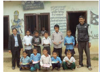
Cahiers et crayons pour les élèves

Une école a bénéficié du programme Renforcement 1 re année , afin d'acheter des matériaux et du matériel pédagogique. Six enfants ont continué à recevoir des écolages/parrainages pour les aider à aller à l'école.