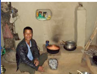
770 poêles et cheminées construits depuis 3 ans

La construction des derniers 360 poêles améliorés dans le VDC de Sikhar Ambote a également été complétée. 770 poêles ont été construits en trois ans, afin de réduire la quantité de fumée à l'intérieur des habitations et ainsi améliorer la santé de la population.