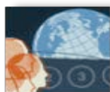
Fondation 3% Tiers-Monde

Collaboration Québec Népal remercie tous les membres, les personnes, les fondations et les organismes qui lui permettent, en donnant généreusement, de réaliser sa mission