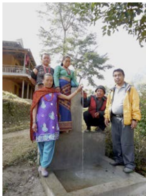
Fontaine d'eau, projet d'eau dans les villages de Khahare/Chuitingtar

potable deux villages ainsi que les maisons qui se trouvent le long du parcours du pipeline (280 maisons). La population a participé activement à la construction : creusement de tranchées,